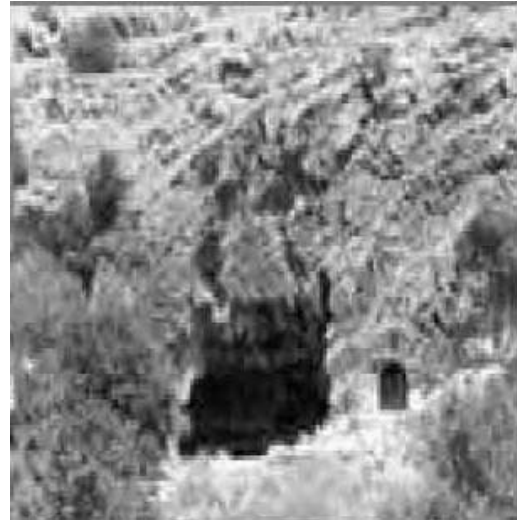
該撒利亞腓立比境內